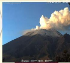
Imagen destacada de las últimas 24 horas

CON LA PARTICIPACIÓN DEL INSTITUTO DE GEOFÍSICA DE LA UNAM